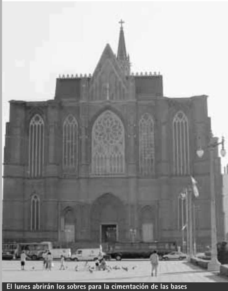
El lunes abrirán los sobres para la cimentación de las bases

"Las pensiones mal cobradas constituyen un hecho ajeno al Instituto. Pero lo de los empleados es más grave", afirmó Cano. Por si fuera poco, las autoridades prevén toparse con otros casos similares.