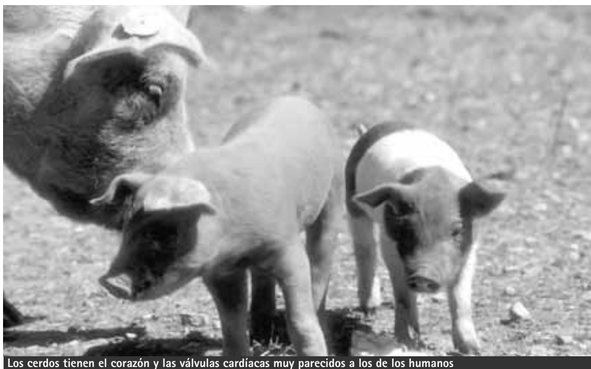
Los cerdos tienen el corazón y las válvulas cardíacas muy parecidos a los de los humanos

Guillermo Berra, integrante del Centro de Investigación de