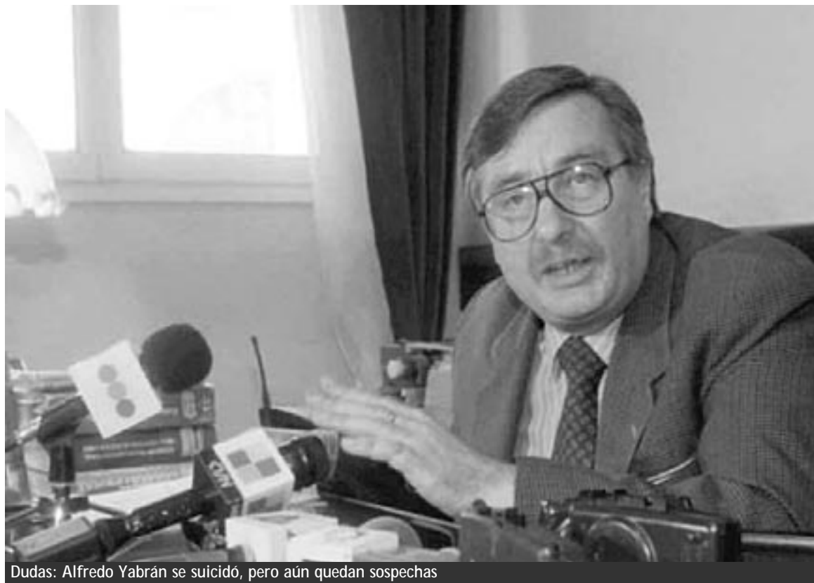
Dudas: Alfredo Yabrán se suicidó, pero aún quedan sospechas

Tampoco se descarta que ante una eventual necesidad se soliciten nuevas pericias, entre ellas la exhumación del cuerpo de Alfredo Yabrán