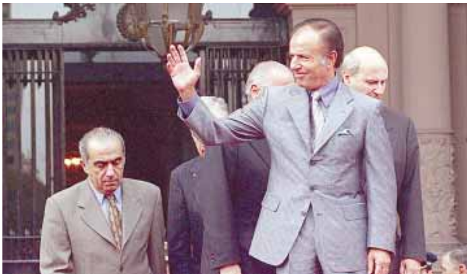
Más poder. Con Parque Norte convalidado, Carlos Menem tiene todo controlado

Si bien ninguna fuente del peronismo se atrevió a confirmar la existencia de una reunión o una conversación telefónica entre Menem y Duhalde, todos los voceros asegu-