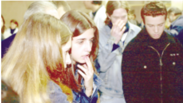
Momento de tensión. Ayer los aspirantes a la carrera de Medicina conocieron los resultados del examen

Apenas 155 de los 1190 jóvenes que se presentaron a rendir el examen de ingreso de la Facultad de Ciencias Médicas de la Universidad Nacional de La Plata (UNLP) respondieron satisfactoriamente al menos 40 de las 60 preguntas de la prueba. Esto representa sólo el 13 por ciento de los aspirantes, quienes ya son considerados alumnos regulares. Mientras que el 87 por ciento restante tendrán un recuperatorio el próximo martes 27.