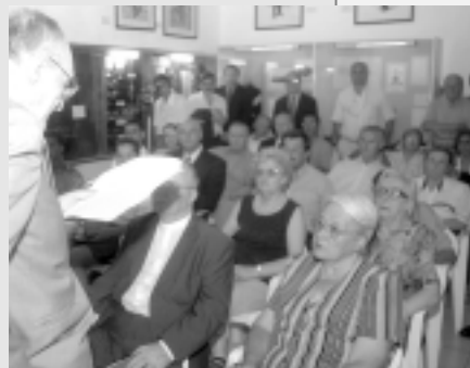
Un pasaje del acto homenaje a Vucetich

Se proyectó un video sobre el primer caso de una persona detenida gracias al sistema de Vucetich