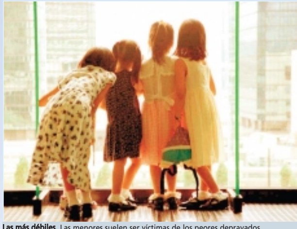
Las más débiles. Las menores suelen ser víctimas de los peores deprivados

El día que detuvieron a Campanella, habían ido a ver la película de Los increíbles . Y en anteriores ocasiones, pasearon por la