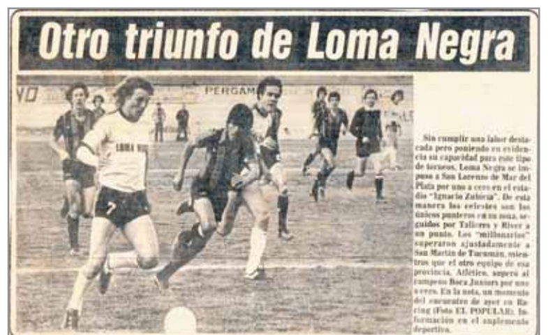
Se acostumbraron. Los buenos resultados de local se daban seguido

Tras la muerte de Alfredo, en 1976, Amalita heredó la presidencia de Loma Negra y construyó un emporio del cemento. Entonces se interesó por el fútbol como elemento de éxito y popularidad. Y le fue bien: compitió con singular fortuna contra River y los grandes del