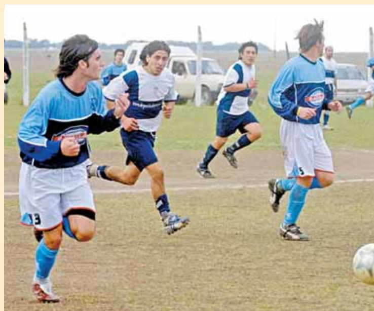
Ahora es Alianza Racing - Loma Negra. Buscó ayuda para no desaparecer

Actualmente se encuentra disputando el torneo Clausura Integración, que une las ligas de Olavarría, Benito Juárez, Lamadrid y Laprida; pero se fusionó con Racing (club del Argentino B) para no extinguirse, y pasó a llamarse Alianza Racing - Loma Negra. En el Apertura no sumó puntos y terminó último en las posiciones de su grupo. Varios de sus cotejos de local los jugó en otras canchas de la zona, al contrario de la época de gloria, donde el césped del estadio de Loma Negra era una reliquia del fútbol de primera.